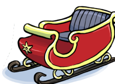
Illustration: Valentin Schönbeck