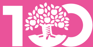
Illustration: Maja Säfström