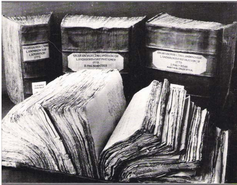
I landskontorens arkiv finns mantalslängder i kolossala volymer ...