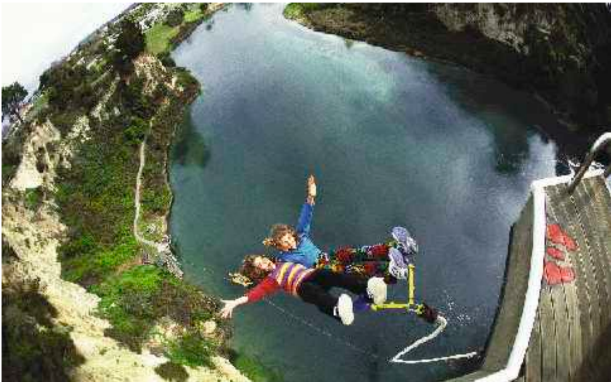
Fig 10. Fritt fall.

I fortsättningen kommer vi att använda bokstaven g i båda betydelserna. Ibland betyder g tyngdaccelerationen vid jordytan, ibland tyngdfaktorn.