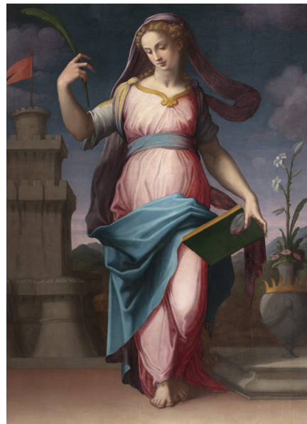
8.4 Santa Barbara. Renässansmålning från Galleria dell'Accademia i Florens.

Under renässansen fick den antika bildningstraditionen ett nytt uppsving manifesterat i synen på skönheten, bildningen och kunskaperna. Humanismens bildningsideal kom att betyda mycket för kulturutvecklingen i Europa.