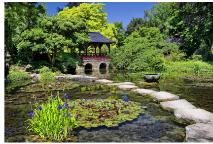
7.1 Människan kan anpassa sig till många olika kontexter. Här två exempel från Japan: den urbaniserade miljön i Tokyo och en japansk trädgårdsmiljö.

Människans kunskaper och färdigheter är till stor del en produkt av de erfarenheter vi gör och den kontext vi lever i. Just denna förmåga är grunden för att vi människor blir så olika – vi utvecklas under hela livet.